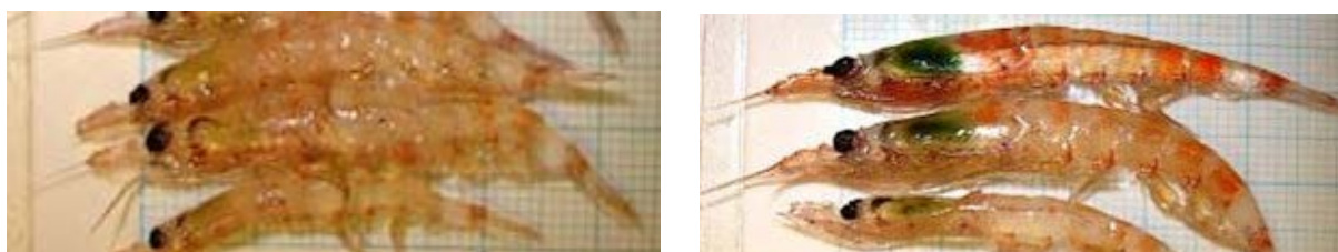
Рис. 3: Цвет криля за счет питания. Фото слева = 0 (прозрачно). Фото справа = 1 (зеленая/коричневая окраска).

Цветность криля: Наличие или отсутствие зеленой/коричневой окраски (см. рис. 3) кишечника или печени (которые свидетельствуют о питании) должно регистрироваться для всего измеряемого криля.